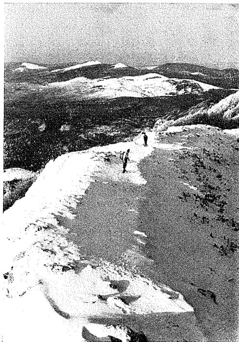
La spalla Nord (qui sopra) e la spalla Sud del M. Maggiore, (qui di fianco)

27 giugno - Vallone dell'Urtier - Dal lago Ponton m. 2600 per il Colle Pontonet m. 2897 al M. Torre Ponton m. 3101.